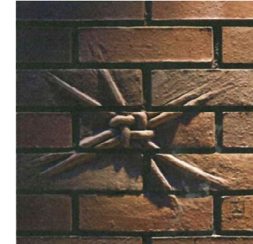
飾り結び煉瓦彫り