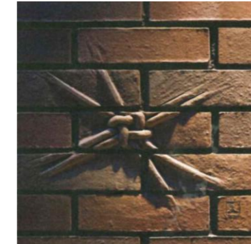
飾り結び煉瓦彫り