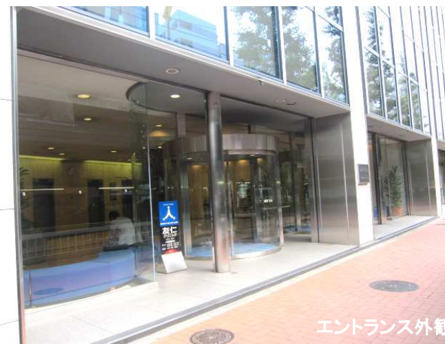
エントランス外観