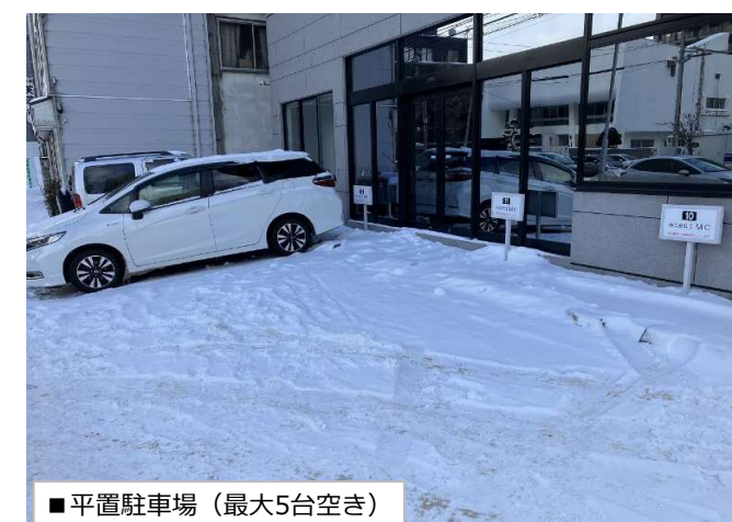
■平置駐車場 (最大5台空き)