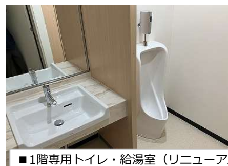
■1階専用トイレ・給湯室 (リニューアル済み)