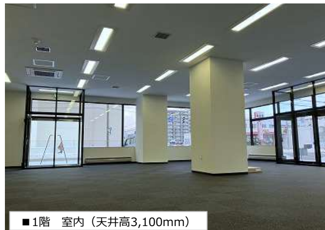
■1階 室内 (天井高3,100mm)